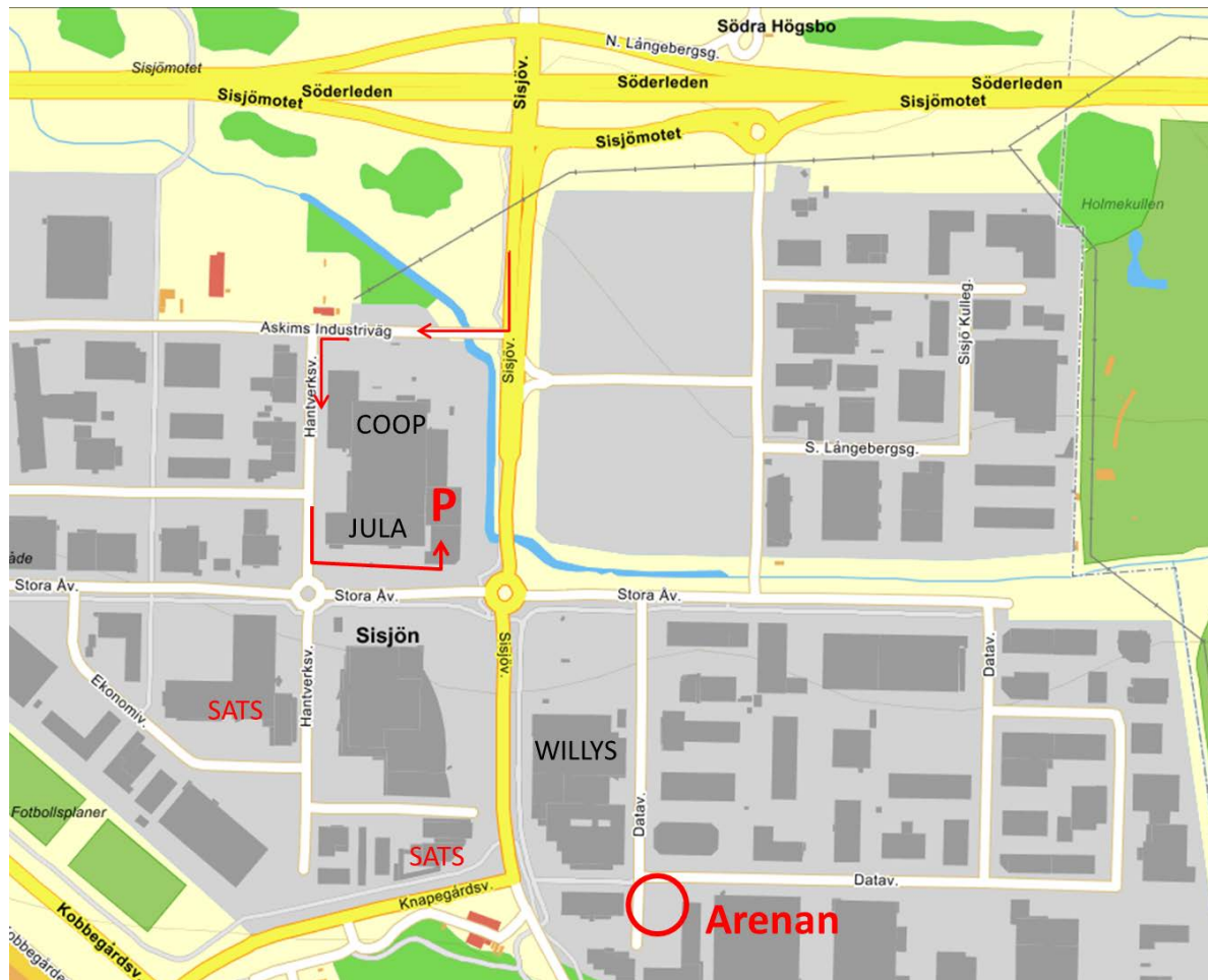
Bild 1. Karta över arenan (start- och målområde), parkering samt omklädning (SATS).